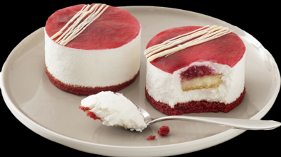
369 Cremoso ai frutti rossi €5.00

delizioso gelato semifreddo allo zabaione con cuore di gelato al caffè e decorato con granella di meringa.