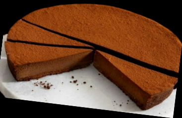
358 Torta Macao €4.00

pallina di gelato alla crema o cioccolato ricoperta da uno strato di pastella fritto in olio di semi.