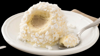
367 Tartufo bianco €5.00

delizioso gelato semifreddo al cioccolato e allo zabaione decorato con granella di nocciole pralinate e cacao.