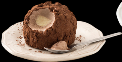
366 Tartufo nero €5.00

delizioso gelato semifreddo al cioccolato e allo zabaione decorato con granella di nocciole pralinate e cacao.