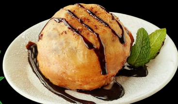
357 Gelato fritto. - Crema o Cioccolato €4.00

pallina di gelato alla crema o cioccolato ricoperta da uno strato di pastella fritto in olio di semi.