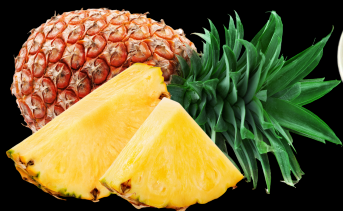
356 Frutta Fresca €4.00