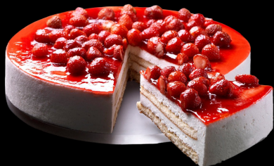
360 CheeseCake Monterosa €4.50

pasta frolla con crema pasticcera al profumo di limone, ricoperta con pinoli e mandorle.