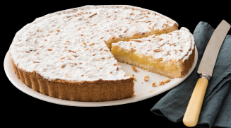
359 Torta della Nonna €4.00

torta al cioccolato fondente con una base di croccanti biscotti al cacao.